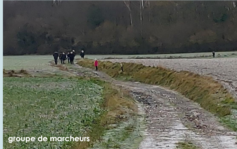
groupe de marcheurs

C'est ce que nous avons vécu ce matin là .